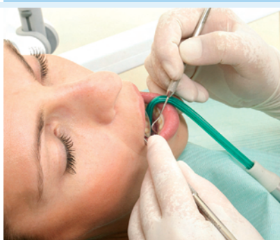
PZR Professionelle Zahnreinigung