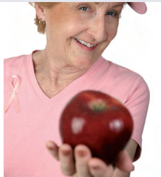
... für mehr Lebensqualität

Mehr Tragekomfort und eine bessere Ästhetik bietet die Kombination aus feststehendem Zahnersatz und Modellgussprothese. Unterschiedliche, speziell angefertigte Verbindungselemente verbinden die eigenen Zähne mit der Prothese. Dafür müssen natürliche Zähne überkront werden, um den Verbindungselementen Halt zu geben. Sichtbare Klammern werden so vermieden.