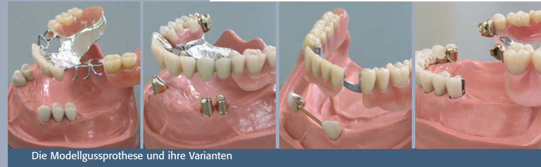
Die Modellgussprothese und ihre Varianten

lenden Zähne nicht mehr mit feststehendem Zahnersatz versorgen, kann es erforderlich sein, diese durch herausnehmbare Teilprothesen zu ersetzen. Sie stellen die Ästhetik und Funktion Ihres Gebisses wieder her und geben Ihnen ein Stück Lebensqualität zurück.