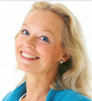
Dauerhafter Zahnersatz ...

Jeder Zahn unseres Gebisses hat eine Funktion und alle Funktionen sind aufeinander abgestimmt. Schon das Fehlen weniger Zähne kann dieses Zusammenspiel empfindlich stören und weitere Schäden zur Folge haben. Kann Ihr Zahnarzt Ihre feh-